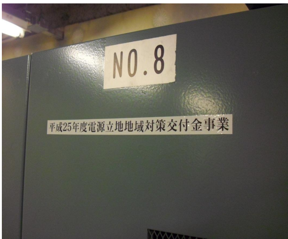
② エレベーター機械室制御盤近影