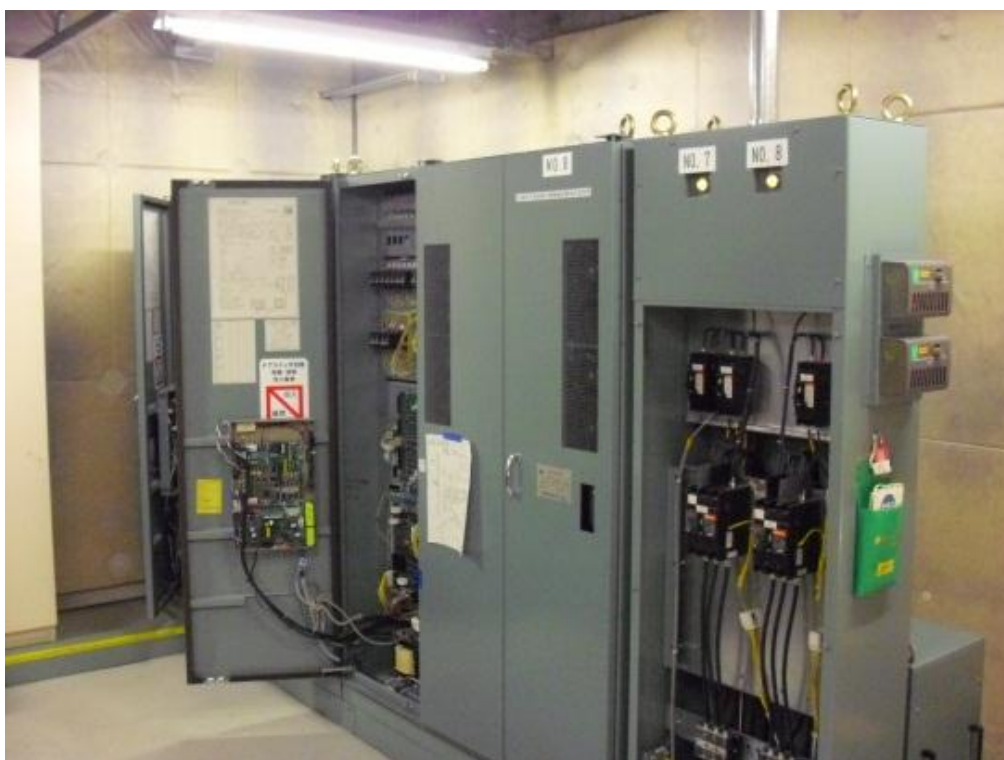
① エレベーター機械室制御盤