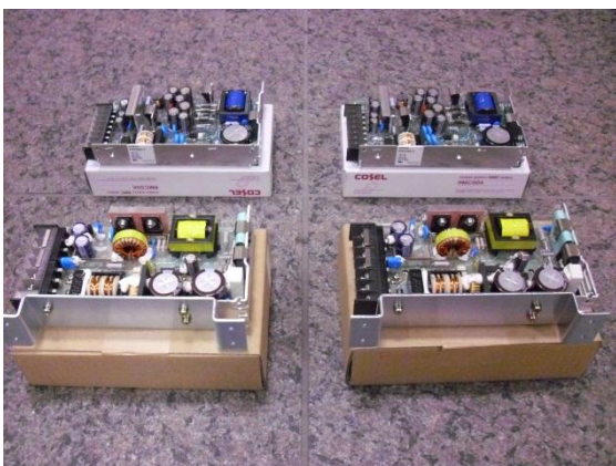
⑤ かご上器具BOX内定電圧装置